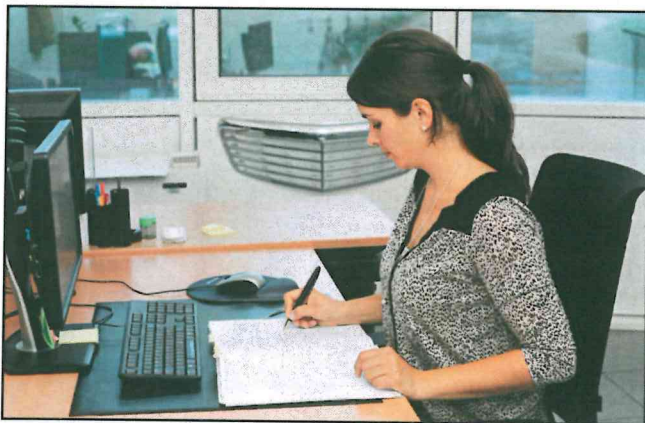
Anfragen notiert die Industriekaufrau genau: „Meine Hauptaufgabe ist es, den Kunden zufriedenzustellen.“