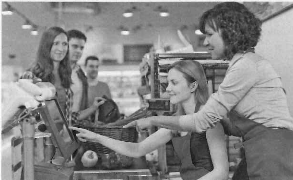
Qualitätssicherung in der Ausbildung ist das Ziel des Ausbilderversprechens im Einzelhandel.